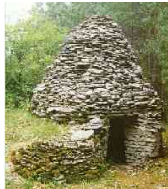
La Konuso da Sukero

Niaj vitokulturaj regionoj en Ĉampanjo estis ruinigitaj ĉirkaŭ la jaroj 1890 pro la filoksera epidemio, kiu detruis tiujn vitejojn ; anstataŭe kreskis la arbaroj enkaŝante la "cadoles" kaj iliajn sekretojn .