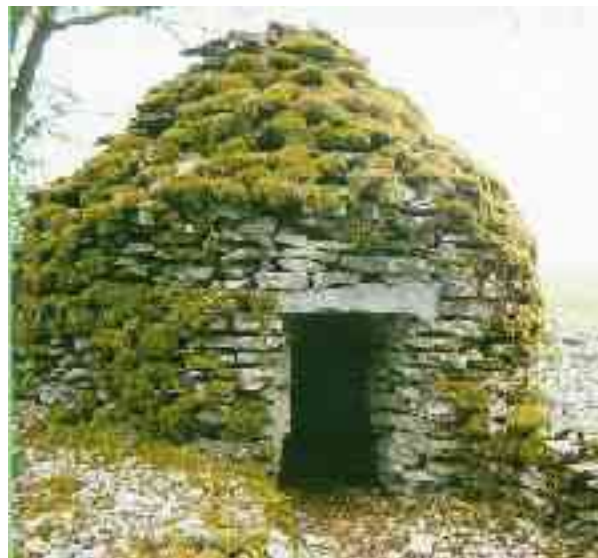
La "Cadole" de Luko

Laboraj atestaĵoj de niaj prauloj kaj jarcenta kultura heredaĵo, la vinberistaj "cadoles" prestiĝaj ambasadoroj de la Ĉampanja departemento "Aube", ankoraŭ defias tempon kaj homojn, fiere starantaj en vinberoj aŭ arbaroj