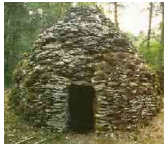
La Granda "cadole" en la Valo "Fremelaire"

Niaj vitokulturaj regionoj en Ĉampanjo estis ruinigitaj ĉirkaŭ la jaroj 1890 pro la filoksera epidemio, kiu detruis tiujn vitejojn ; anstataŭe kreskis la arbaroj enkaŝante la "cadoles" kaj iliajn sekretojn .