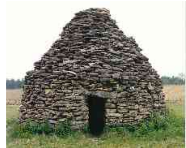
La granda komunuma "cadole" "antaŭ Champraux" (pr. Ŝampro)